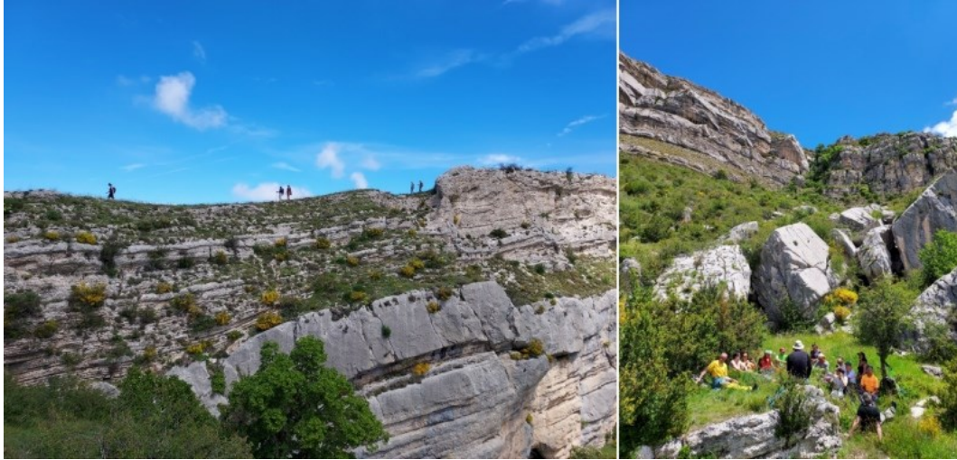
La crête de la falaise dite des indiens (1350 mètres) et la conférence au pied de la faille du chaos