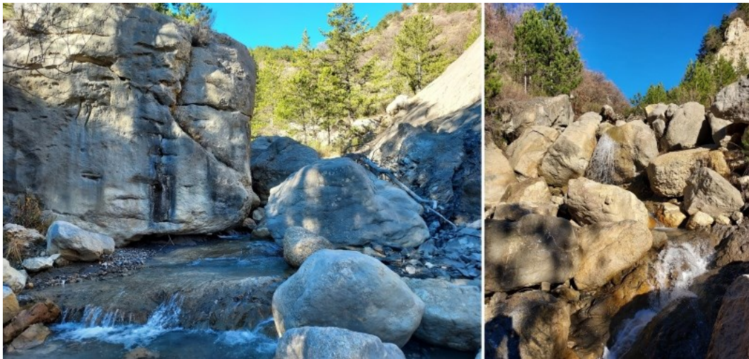
Les gorges dites de la création (800 mètres d'altitude) en contrebas de l'Estachon (1040 m)